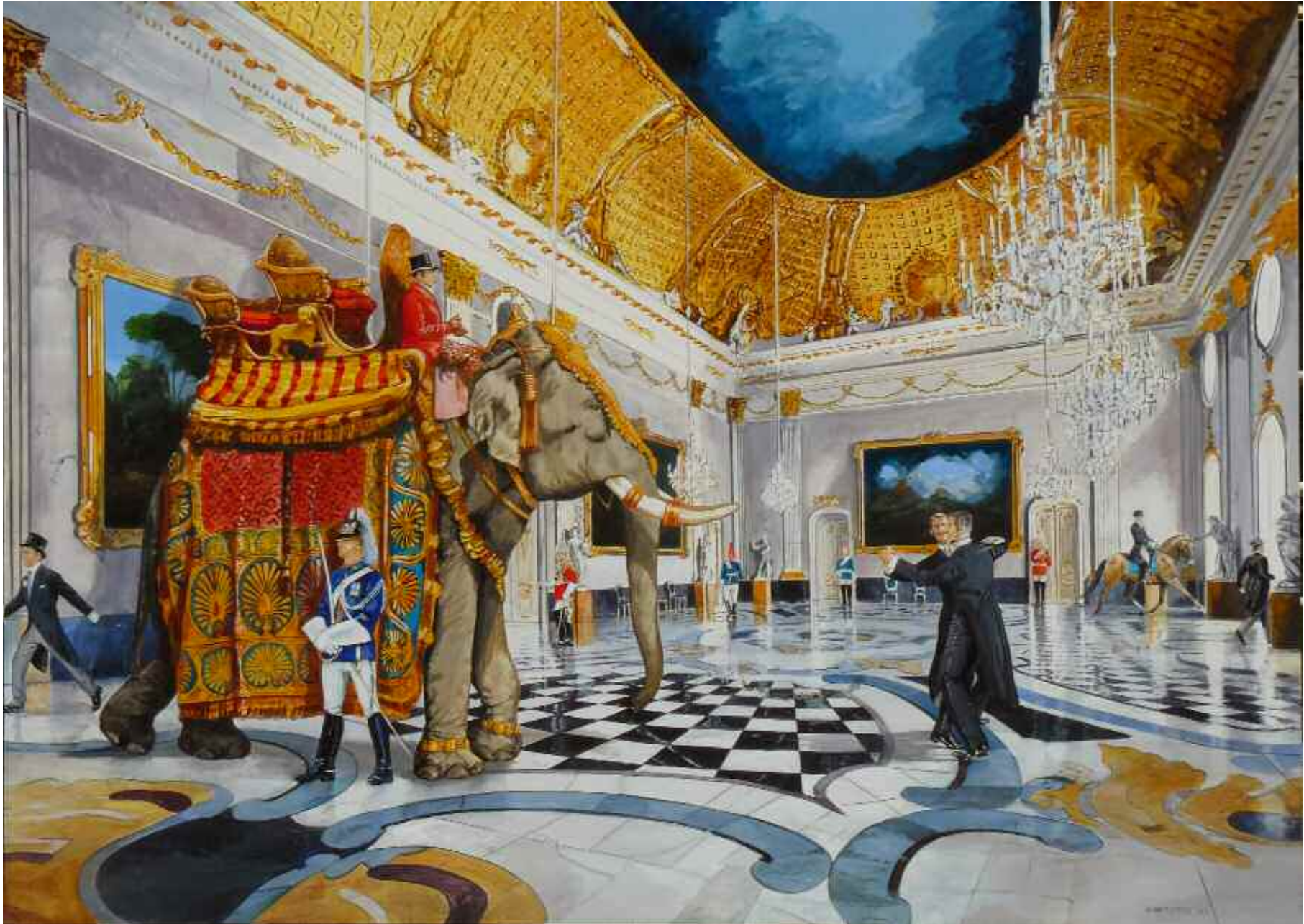
La valse du Grand Tour - Acrylique sur toile. 190 x 280 cm. 2009