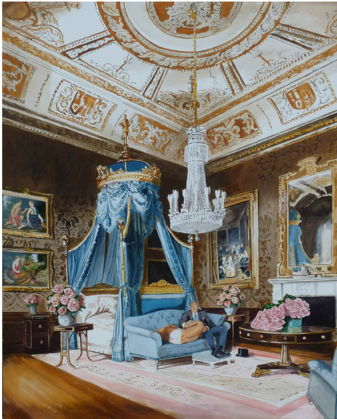
My Other Self , Acrylique sur toile, 195 x 155 cm. 2009