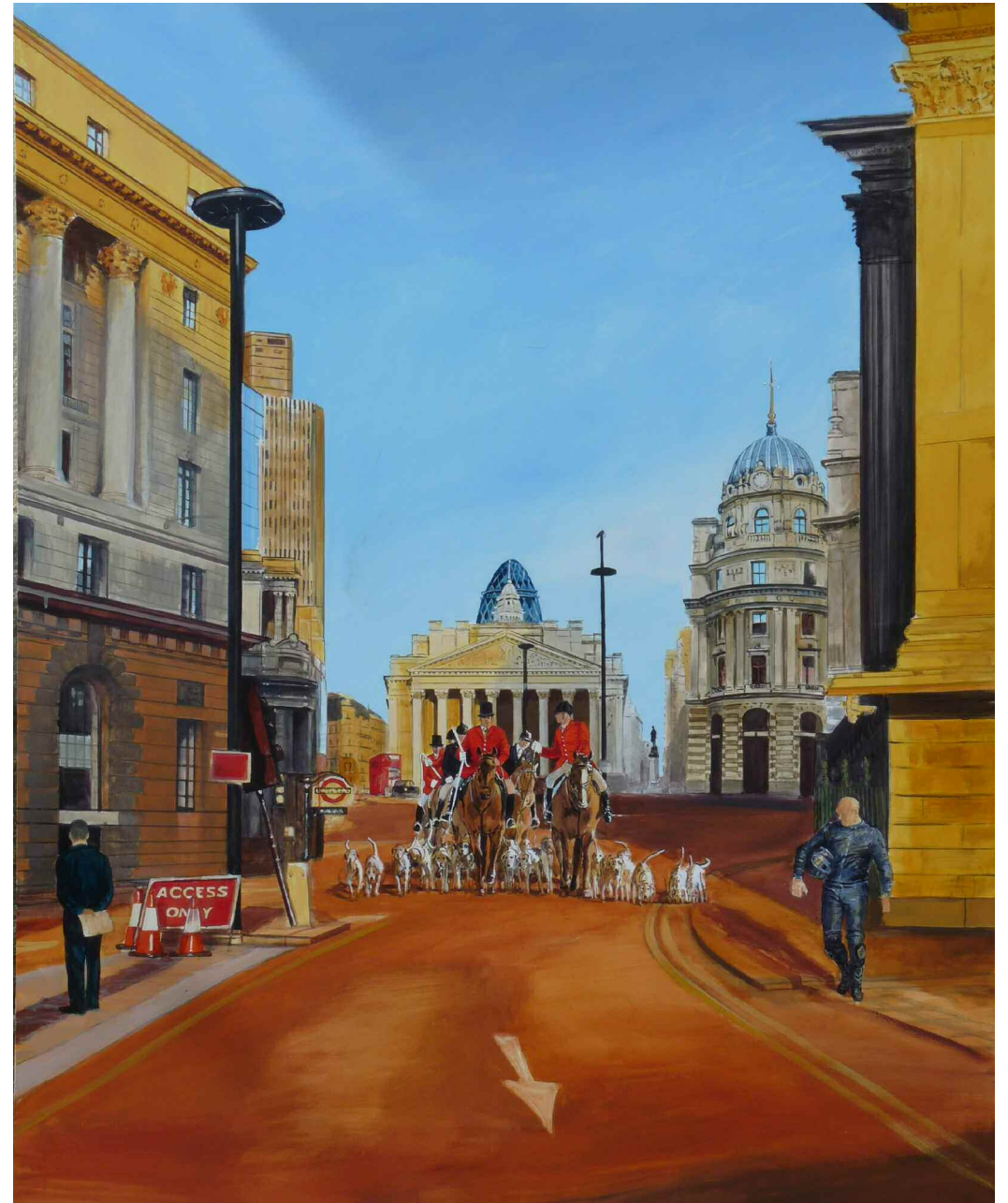
Escena de caza - Acrylique sur toile. 2009